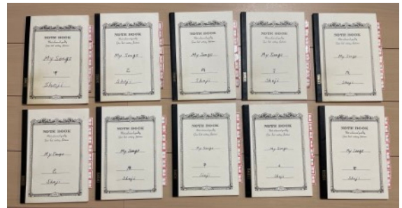
採番：甲乙丙丁戊己庚辛壬癸

最初の頃は歌う時もこれを使っていたので、右下写真の左上のノートは持ち手で汚れています。現在は歌うときはiPhoneに書いた「メモ」を見ながら歌っていて、歌いにくい歌詞は都度その場で修正しています。そして最後にギターを録音する前にやっと書き留めるようになりました。いくら作詞したとはいえ、これだけ量が増えればほとんどがうる覚えです。なので将来もしもライブをすることがあるとすればこの制作ノートが役立つでしょう。